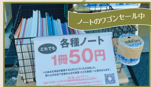
ノートのワゴンセール中

水場から「ゴボツ…」という音がしたかと思うと、一気に水があふれだしました。全員で掃除をしてなんとか現状復帰。こんな日がなんと2回もありました。