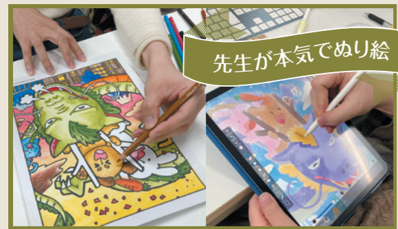
先生が本気でぬり絵

とある文房具店が閉店するため、たくさんのノートをいただきました。売り上げは杉並みんなの食堂へ寄付します。通りがかりにのぞいてくれる方がいて嬉しいです！