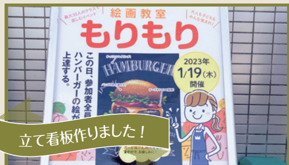
立て看板作りしました！

「ハンバーガーの絵描き歌」を、スタッフ全員でレコーディングしました。機材を使っただけの本格的な録音にドキドキ！編集で歌とピアノとパーカッションを合わせて、楽しい絵描き歌になりました♪