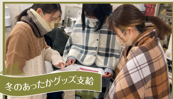
冬のあったかグッズ支給

節電のための防寒グッズが支給されました！ネックウォーマーや羽織れるひざ掛けなど、今年は予算内でそれぞれが好きなものを選び、早速愛用しています。