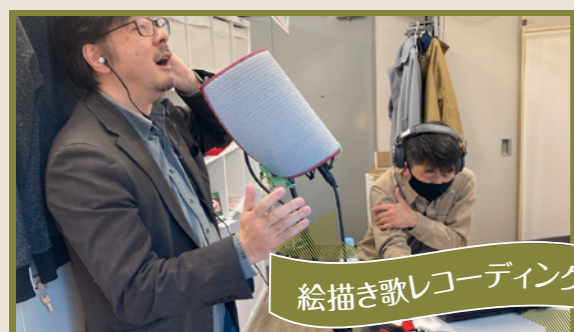
絵描き歌レコーディング

節電のための防寒グッズが支給されました！ネックウォーマーや羽織れるひざ掛けなど、今年は予算内でそれぞれが好きなものを選び、早速愛用しています。